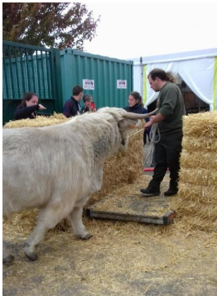
Image 1 : arrivée des animaux au Sommet de l'Elevage 2018