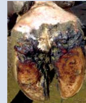
Erosion du talon

Pour les reconnaître, il faut être formé ou faire appel à un professionnel (pédicure ou vétérinaire).