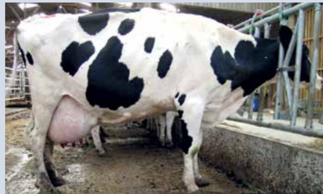
Dos arrondi en statique