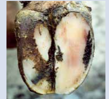
Ouverture de la ligne blanche