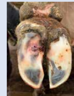
Ulcère de la sole