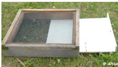
Photo 1 : Tiroir de fond de ruche associé à un plancher grillagé, utilisables pour le comptage de chutes naturelles de varroas